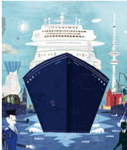
Event-City: Hafen-Geburtstag, Cruise-Days, Marathon, Triathlon, Motorradtreffen, Alstervergnügen prägen heute das Leben in der Innenstadt und locken zahllose Touristen

Hamburg entwickelt sich immer weiter zu einer Event-City mit großen internationalen Sportereignissen wie dem Marathon, Triathlon, Beachvolleyball-Meisterschaften, Alsterläufen, dem Tennisturnier am Rothenbaum, mit diversen Alster-Vergnügen, dem Hafengeburtstag, den Cruise-Days, dem Motorrad-Gottesdienst und den Harley-Days. Hamburg ist die Musical-Stadt mit jährlich mehr als zwei Millionen Besuchern. Fast täglich legt